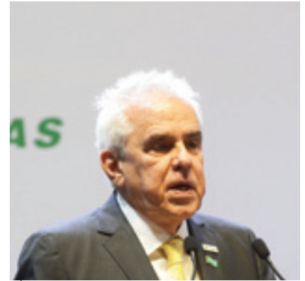
SOLENIIDADE DE POSSE DO ECONOMISTA ROBERTO CASTELLO BRANCO OCORREU NA SEDE DA ESTATAL, NO RIO DE JANEIRO.

Nas 27 unidades federativas – 26 estados e o Distrito Federal –, apenas dez governadores foram reeleitos em 2018 e, mesmo assim,